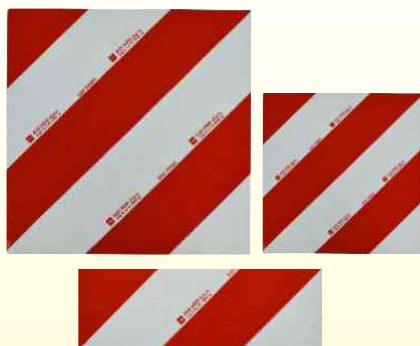
Table različnih dimenzij so namenjene označevanju, v prometu izpostavljenih delov vozil. Kot so na primer, širši traktorski prključki, gradbena mehanizacija, izredni prevozi širokih in dolgih predmetov, izven gabaritov vozila. Skladne so s slovenskimi in evropskimi predpisi. Table imajo kovinsko osnovo, nanjo je nalepljena svetlooodbojna 3M foliija. Vse table dosegajo in presegajo zahteve standarda DIN 11030.