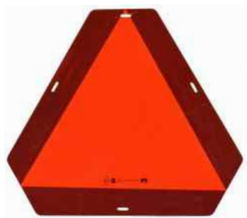
Tabla ECE 69.01 za označevanje počasnih vozil do 40 km/h

Trikotna tabla, s prisekanimi vogali, dimenzije 360 x 460 mm ima aluminijevo osnovo, nanj sta nalepljeni dve vrsti folije 3M. Notranje fluo oranžno jedro zagotavlja odlično vidnost od zmanjšani vidljivosti v megli, dežju ter mraku. Rdeča obroba, ki je visoko svetlooodbojna pa zagotavlja odlično vidnost ponoči. Tabla dosega in presega zahteve ECE 69.01.